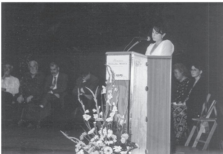
Nunha homenaxe a Manuel María, en 1995

que chegou en setembro de 1991 e do que xa non se moveu. Nel desenvolveu un intenso labor organizativo e promotor de diversas actividades culturais, especialmente literarias, sendo tamén a Xefa do Departamento de Lingua e Literatura Galegas dende 1995.